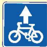
Полоса для велосипедистов