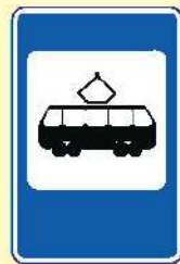
Место остановки трамвая