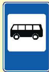
Место остановки автобуса и (или) троллейбуса

ПРАВИЛА ДОРОЖНОГО ДВИЖЕНИЯ ОДИНАКОВЫ ДЛЯ ВСЕХ – ВЗРОСЛЫХ И ДЕТЕЙ!